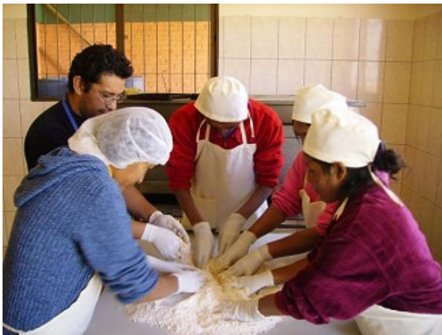
Casa Emaus - 2008